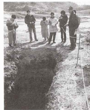
香川県豊島のゴミの上で

ば、タイのバンコクやチェンマイで出たゴミが自分の村で捨てられ、自然が壊されるのかと考えると、それはとても良くないと思った。でも、誰が悪いかは難しい。ゴミの会社の人や政府の人が悪かったのもあるけど、町の人がゴミをたくさん捨てるのも良くないと思う」