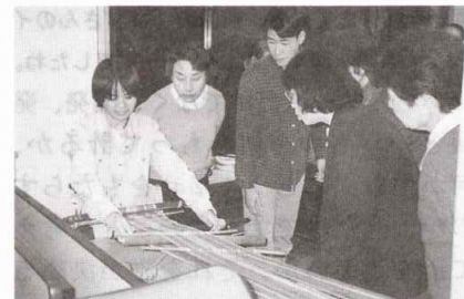
カレン伝統の機織りの実演会(東京都梅ヶ丘教会)

今年度も、東日本・西日本研修旅行の折には、たくさんの方々のお世話になり誠にありがとうございました。おかげ様で大きく体調を崩すこともなく、無事全日程を終えることができました。