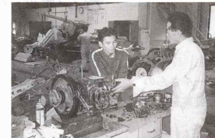
江府町のJA鳥取西部で

大切なので、帰ってから機械を触りつづけることが大事でしょう」とアドバイスをいただきました。