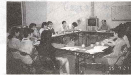
学習会では私たち自身への問いかけがなされた。

昔の日本では雑木は薪として、また落ち葉が積もって腐葉土と化したものはたい肥として利用していましたが、薪が石