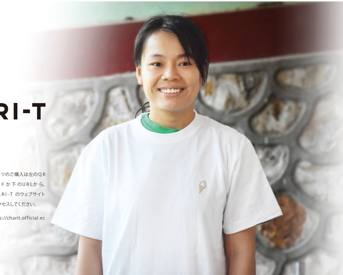
"MOEMOE" Tシャツを着るモーモーさん

Tシャツのご購入は左のQRコードか下のURLから、CHARI-Tのウェブサイトへアクセスしてください。 https://charit.official.ec