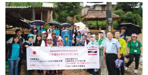
7月31日～8月5日タイスタディツアー・中学・高校生リーダー研修。写真は水施設支援事業を行う、アカ族の村を訪問した際の様子。