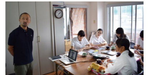
7月9日育英西中学校の生徒さんたちが課外授業。(PHD協会事務所)