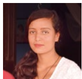
アシカさん 女性 22歳 ネパール

応募条件: 当会事務所から公共交通機関で1時間以内で通える範囲のご家庭。 *詳しくは、お問い合わせください。