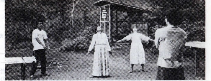
〈農文塾〉 1983年9月 朝の体操(みんなバラバラです) Morning exercise