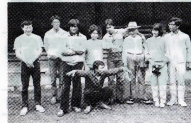
たば農文塾で日本人参加者と一緒にPHD trainees with Japanese participants at Nobun-Juku.

今回は6月からの第1期研修生の様子をご報告します。まず修学旅行の意味あいで東京に出かけた。