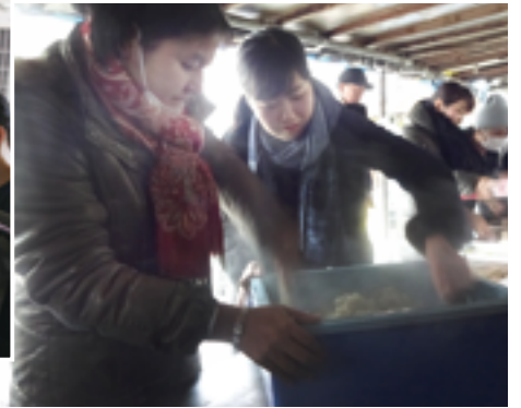
大阪・釜ヶ崎（あいりん地区）での研修