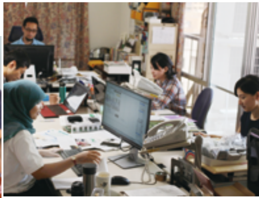
神戸の事務所の様子