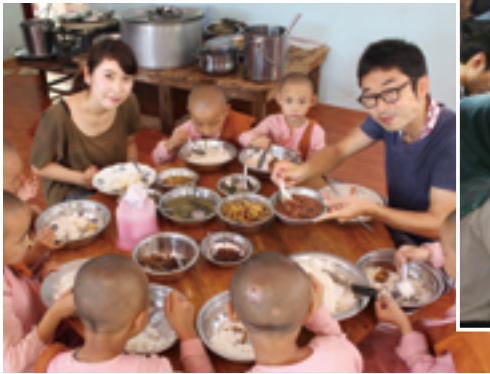
夏のスタディツアー（ミャンマー）